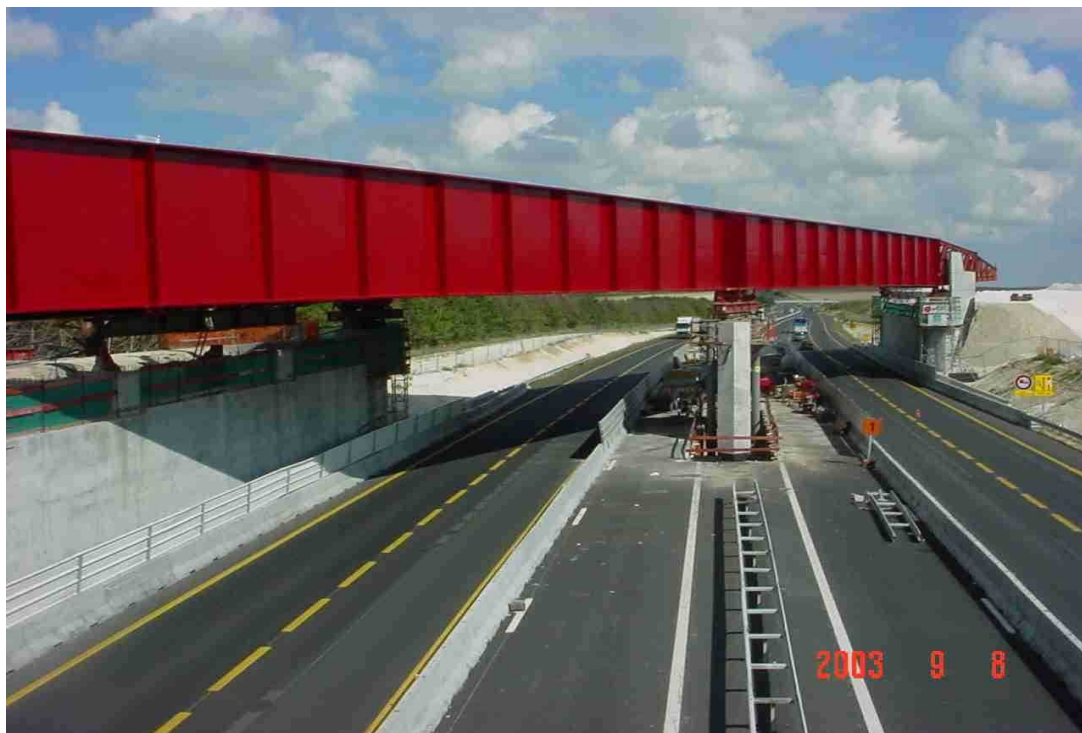
Viaduc sur l'A4 à Bussy-le-Château en fin de lancement