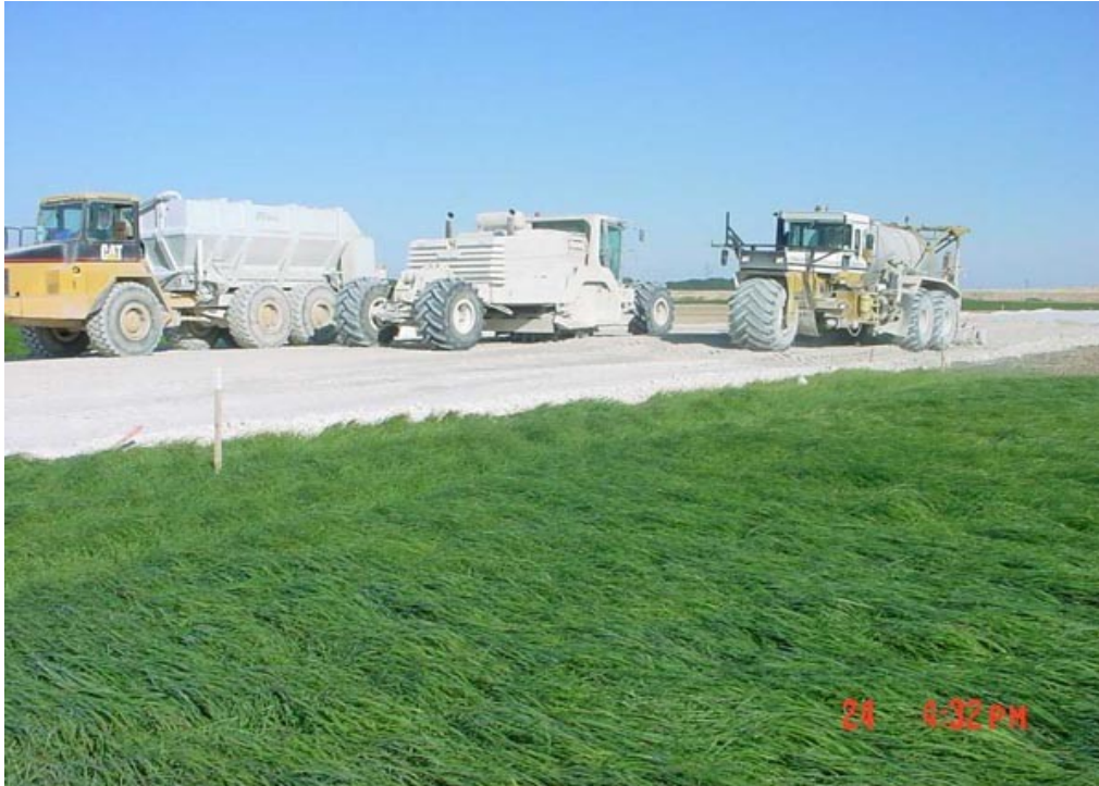
Atelier de traitement de la craie